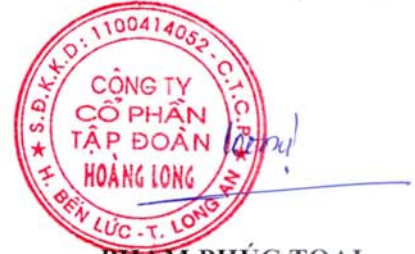
PHẠM PHÚC TOẠI