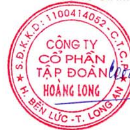
PHẠM PHÚC TOẠI